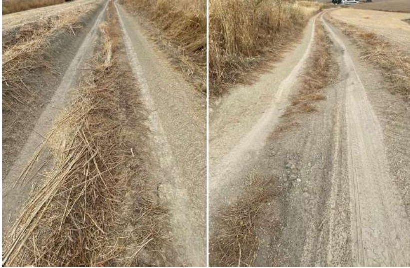
Fotos Ilustrativas de estado actual de Cordel de Granada. Tramo IV, donde se pretende actuar.

Por lo tanto, se puede concluir que se hace necesario realizar actuaciones tendentes a su reposición y mejora del mismo, independientemente de las necesarias labores de mantenimiento y conservación que se deberá llevar por la Administración competente cuando concluya dicha actuación.