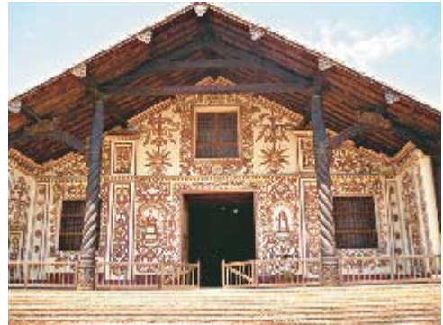
Iglesia de San Miguel

Los trabajadores agrícolas tenían a su cargo la producción de cereales para su alimentación, las mujeres, se ocuparon de los textiles, los artesanos y constructores se encargaban del material para la construcción de obras, tales como el majestuoso templo en honor al Arcángel San Miguel.