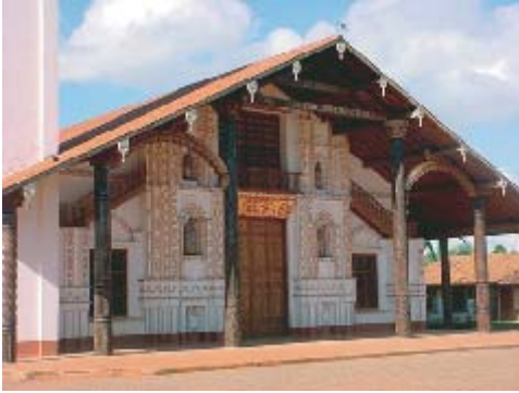
Templo actual de San Ignacio

El actual templo de San Ignacio, no es ninguno de los anteriores pues el pueblo misional sufrió un traslado ya en los comienzos de su historia con población de Zamucos, Satiensos, Ugaronos, y Tapios.