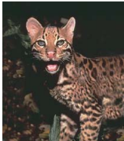
Gato del monte

Se pueden encontrar cerca de 139 clases de mamíferos como tigres o jaguares leones o pumas antas, o tapires, monos, y el ciervo de los pantanos. Dan protección a 33 especies en peligro de extinción.