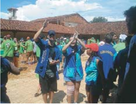
Fiesta de carnaval

2ª o 3ª semana de Febrero: Fiestas de Carnaval