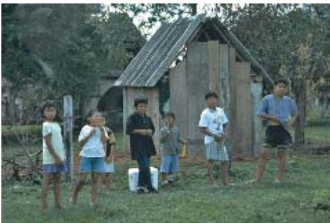
Niños de la región

Existen poblaciones que no superan los 1500 habitantes que intentan prosperar tras la caída de la industria del caucho, con los recursos de la zona. La mayoría pertenecen al linaje Chiquitano.