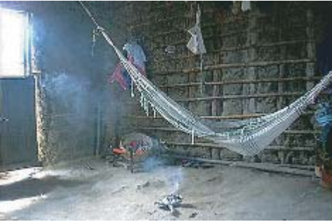
Hamaca en el interior de una vivienda

Llegaron a conocer la metafísica, domesticaron animales como el perro y aves de corral, lograron teñir sus hilaturas y mezclar los colores artísticamente en sus tejidos, y también barnizar las tutumas al fuego con resinas vegetales.