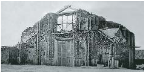
Ruinas de la Iglesia de San Ignacio

Los pueblos misionales han cambiado en el transcurso del tiempo desde la expulsión de los jesuitas; este cambio se acentuó especialmente en el siglo pasado, de modo que es difícil reconocer el esquema urbanístico original. Muchos edificios han sido destruidos, o se han desmoronado por el abandono, por ejemplo los talleres, o los muros exteriores.