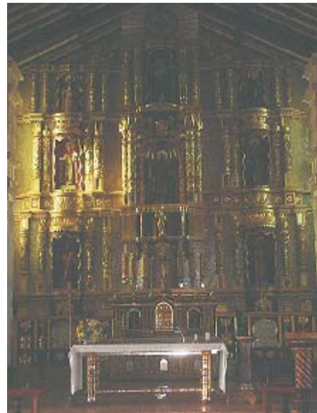
Altar de la Iglesia de San Ignacio