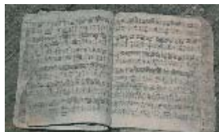
Partitura de música en Santa Ana

El hecho es que en los siglos XVI y XVII, en las casas jesuíticas de Europa la música era considerada como una importante herramienta para la proclamación del Evangelio, capaz de acercar el pueblo al creador, estimular su piedad, y hacerlo mas participe de la vida de la iglesia.