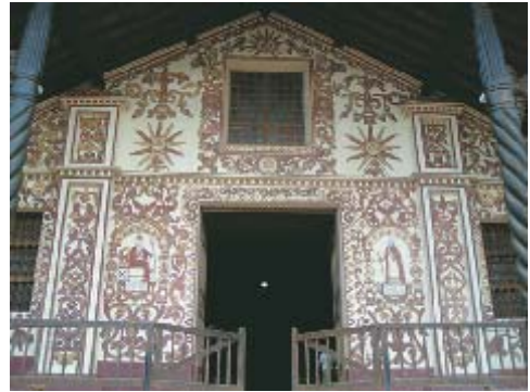
Iglesia de San Miguel

Metódicos en su construcción, supieron manejar lo práctico, y lo conceptual de la iluminación, muy importante en las iglesias europeas del Barroco y el Rococó, ya que existían antecedentes generados por la Arquitectura Bizantina, y Gótica, y que tuvieron un importante desarrollo en el Renacimiento y el Barroco.