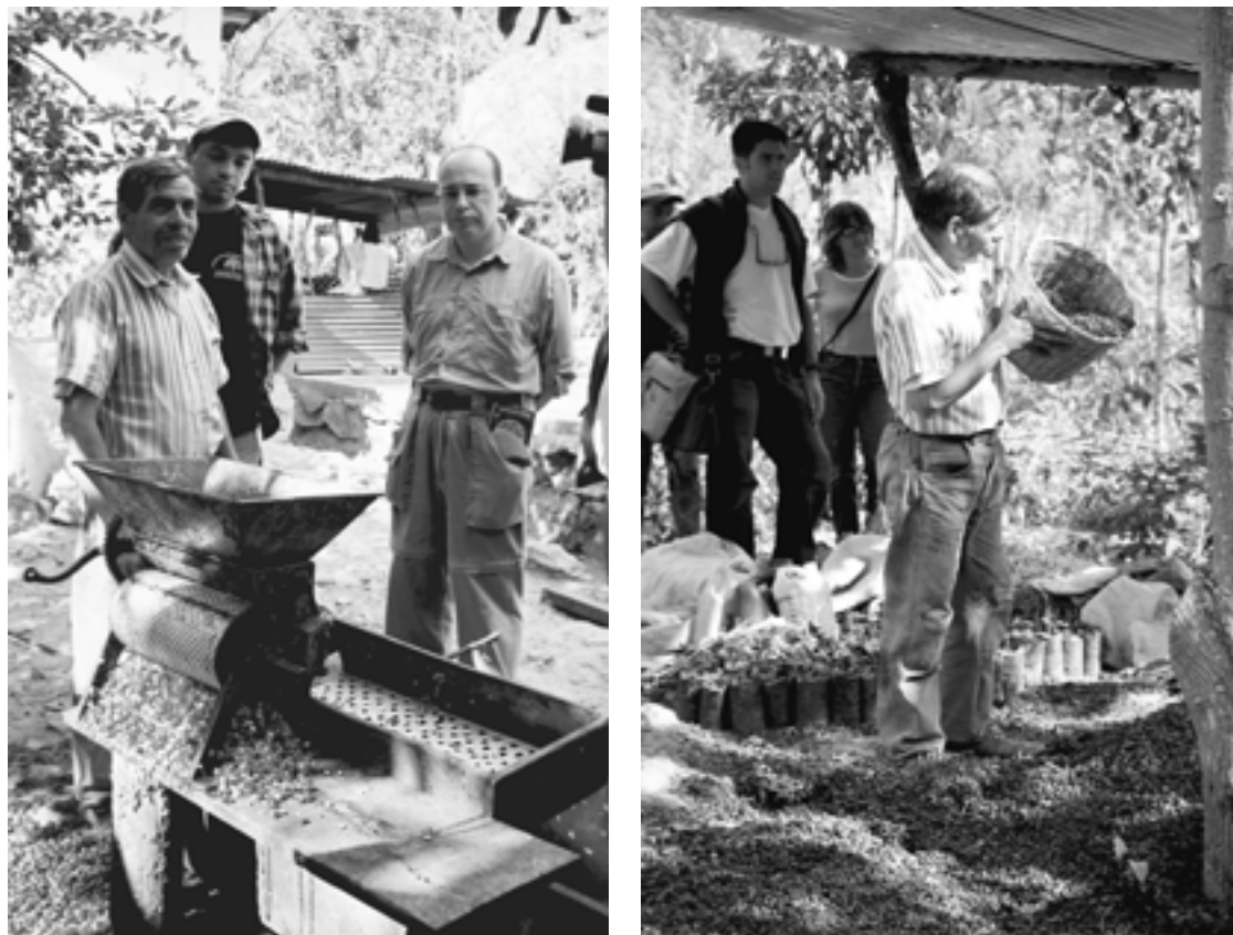
Foto 22 y 23: Proceso de tratado de café orgánico (descascarillado y utilización como abono orgánico de la cáscara)

actuaciones. En general éstas han cubierto algunas compensaciones para los grandes productores (quienes han reportado grandes pérdidas), pero han dejado de lado las compensaciones dirigidas a pequeños productores, como es el caso de la población de Huehuetenango.