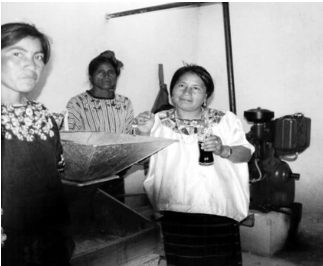
Foto 20 y 21: campos de cultivo apoyados por el proyecto con micro riego y micro empresarias de la zona.